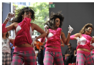
Turnen bei BLUME GRAN CANARIA

Canaria verbreitet. Schauvorführungen, Turniere, Workshops und gemeinsame Veranstaltungen werden